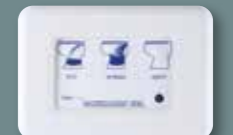
Clavier électronique Luxe