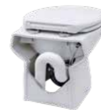
Évacuation vers le bas