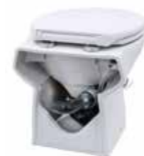
Autre possibilité d'évacuation