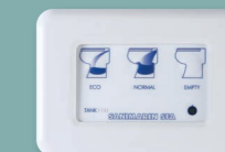
Clavier électronique Luxe