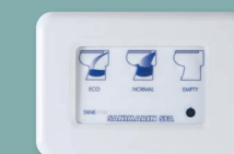
Clavier électronique Luxe