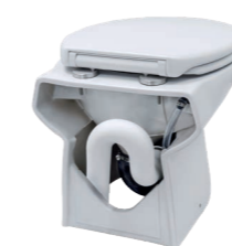
Évacuation vers le bas