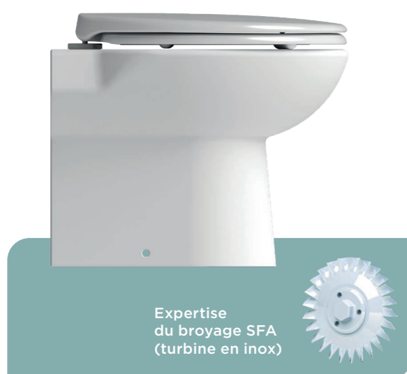
Expertise du broyage SFA (turbine en inox)