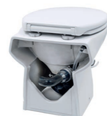
Autre possibilité d'évacuation