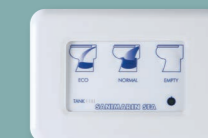
Clavier électronique Luxe